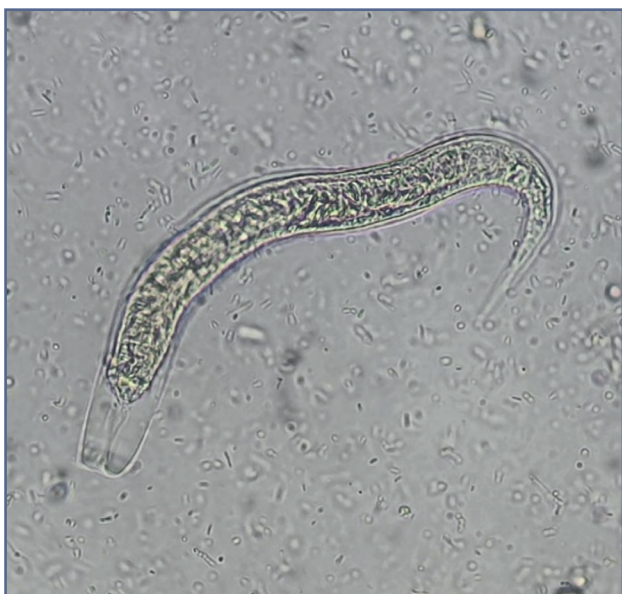
Figura 2 – Strongyloides stercoralis en muestra de heces.

Las tres muestras de heces recogidas fueron positivas para Strongyloides stercoralis (Fig. 2), lo que fue confirmado en cultivo de semen y por la presencia de anticuerpos IgG anti S. stercoralis en suero con un índice de 1,48 (resultado positivo: > 1,00).